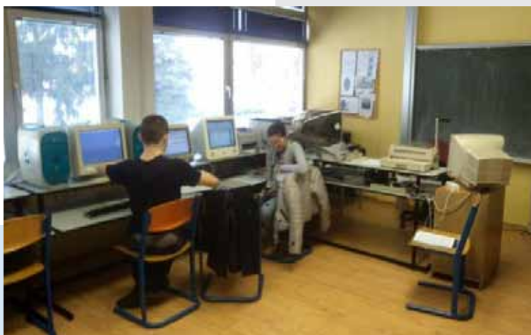
Informatička učionica u Centru za odgoj i obrazovanje Dubrava