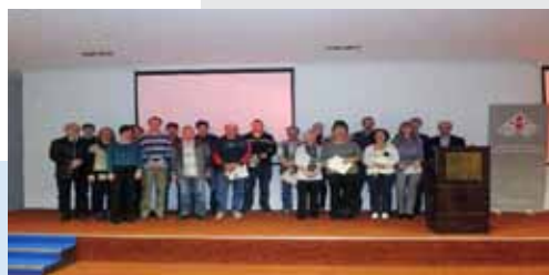
„Završna konferencija projekta“