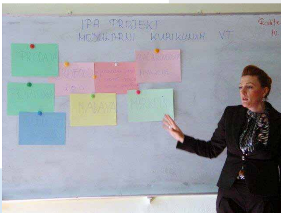
Funkcioniranje vježbovne tvrtke – prezentacija Pilot projekta