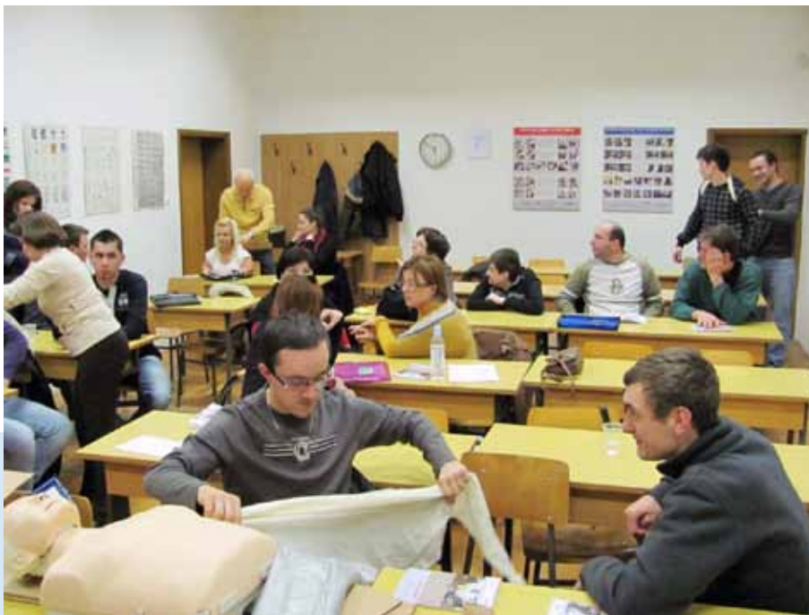
Sati obuke tijekom provedbe projekta