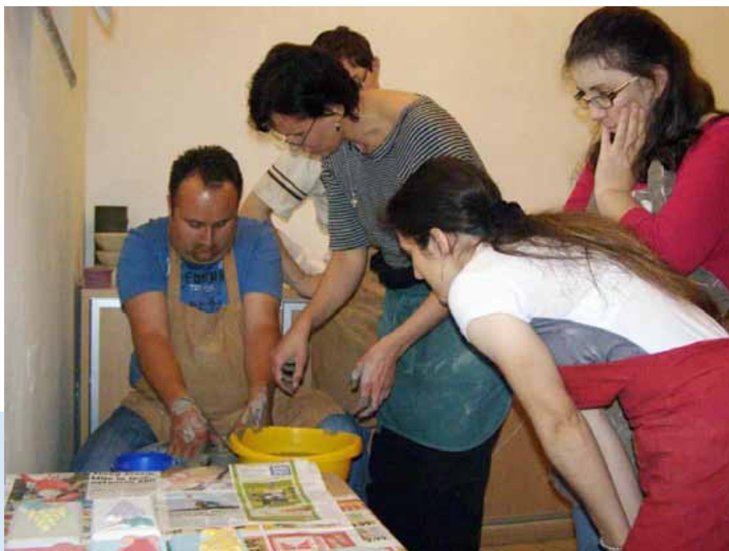
„Polaznici i predavači zajedno na tečaju keramike“