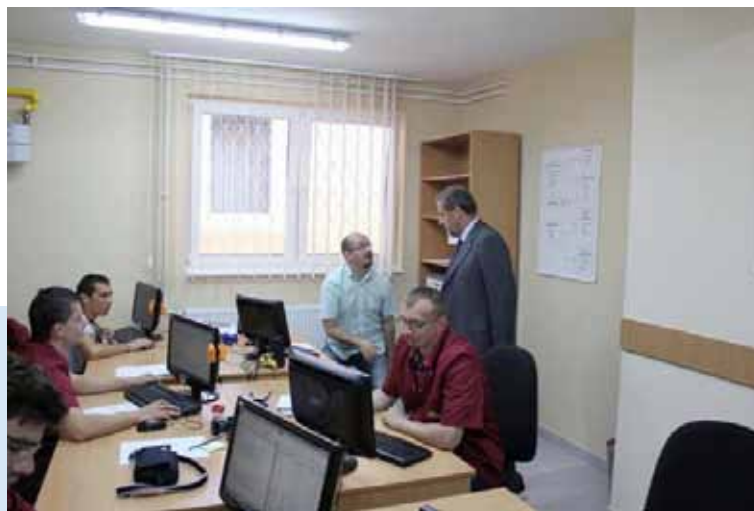
Aktivnosti u virtualnoj radionici