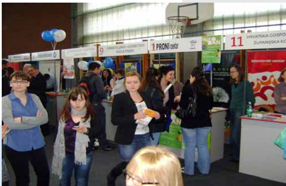
„Info dan u Osijeku“