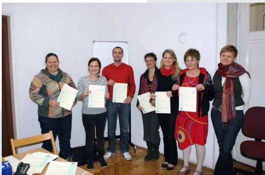
„Certifikacija upravljanja volonterima“