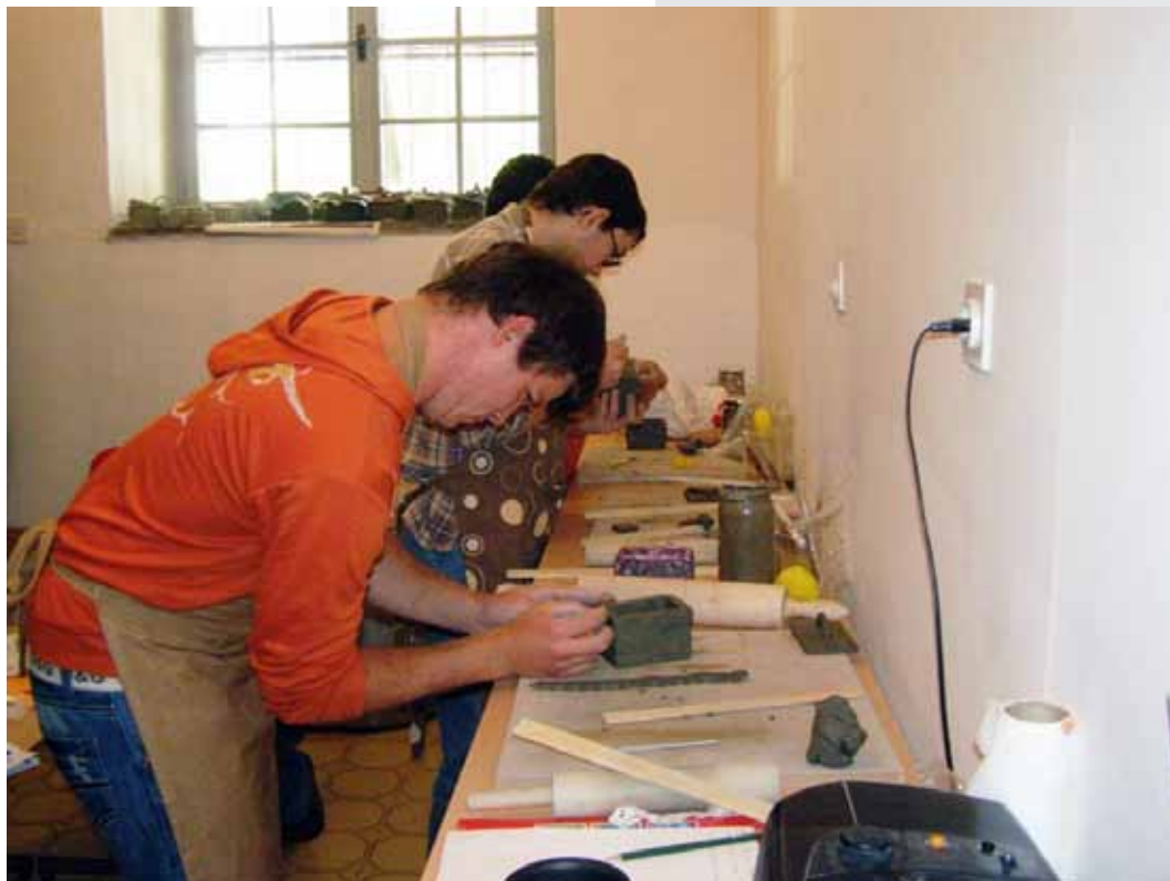
„Sudionici projekta stječu umjetničke vještina u proizvodnji suvenira od keramike“