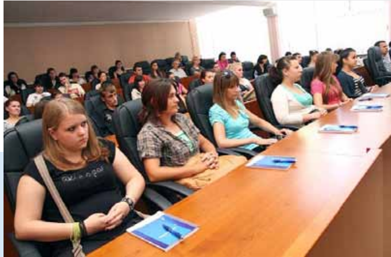
„Susret s poslodavcima“