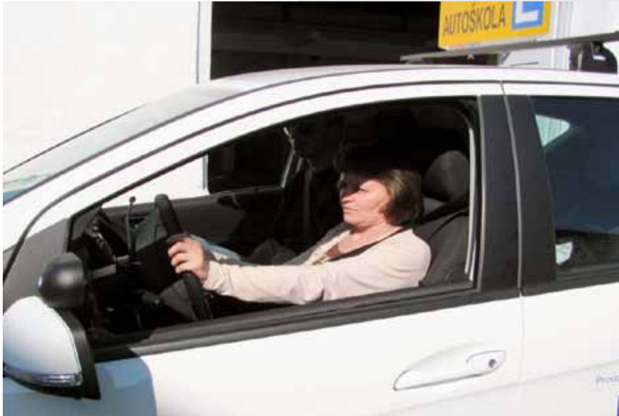
Posebno opremljeni automobil, prilagođen potrebama osoba s invaliditetom