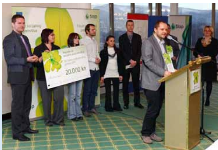
„Prva nagrada za socijalno poduzetništvo dodijeljena je organizaciji ACT Čakovec“