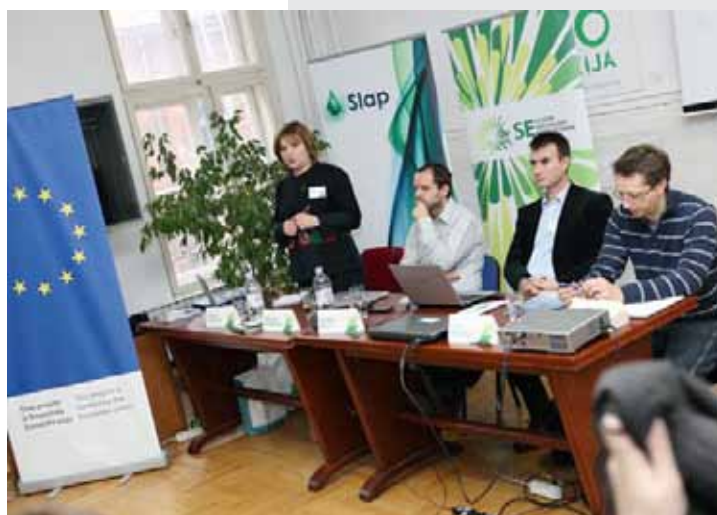
„Radionica s institucijama u okviru projekta SEFOR“