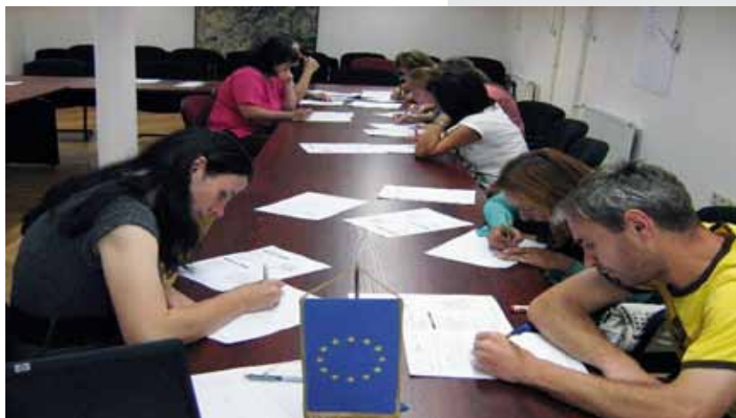
„Radionica komunikacijskih vještina“