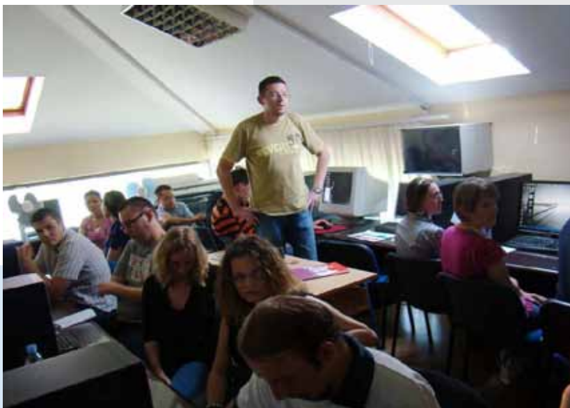
Mentorska aktivnost u okviru projekta