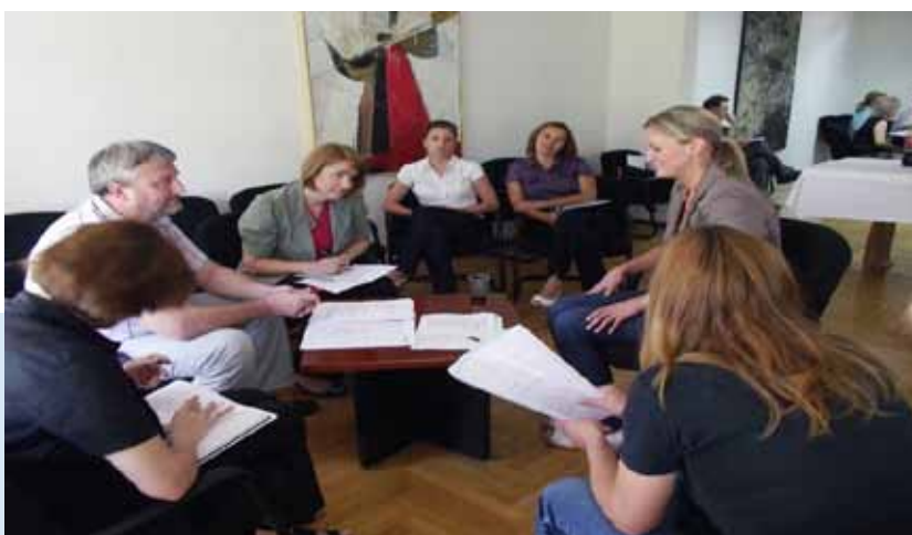
„Simulacija razgovora za posao s poslodavcima“