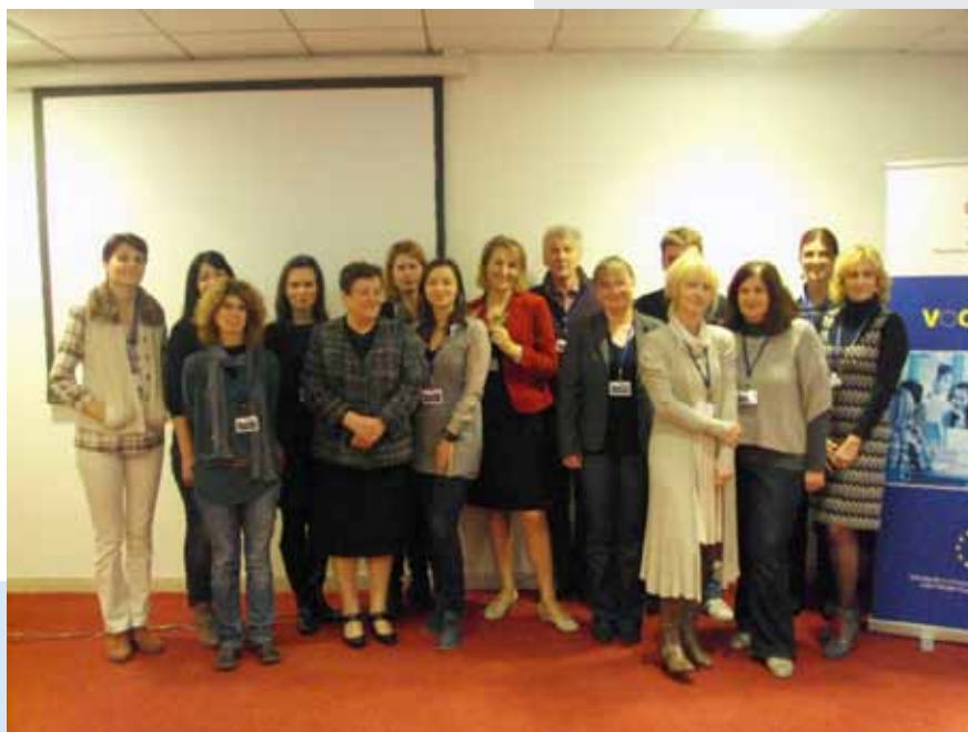
Edukacija za profesoreu sklopu projekta