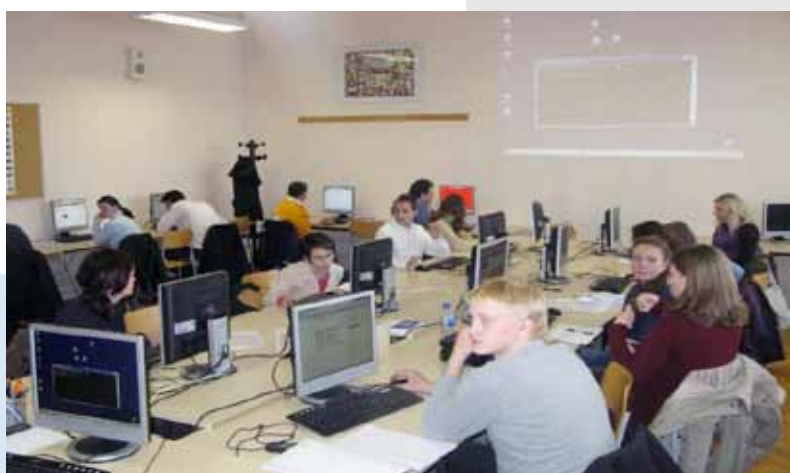
Provedba računalnog tečaja u okviru projekta