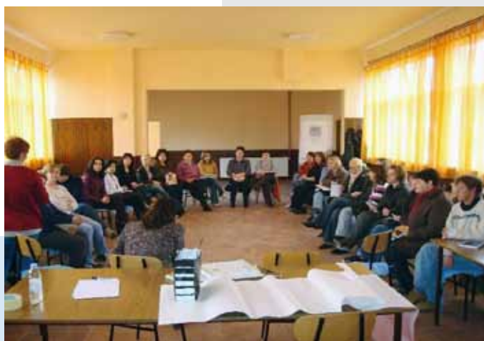
„Edukacija iz psihološke podrške“