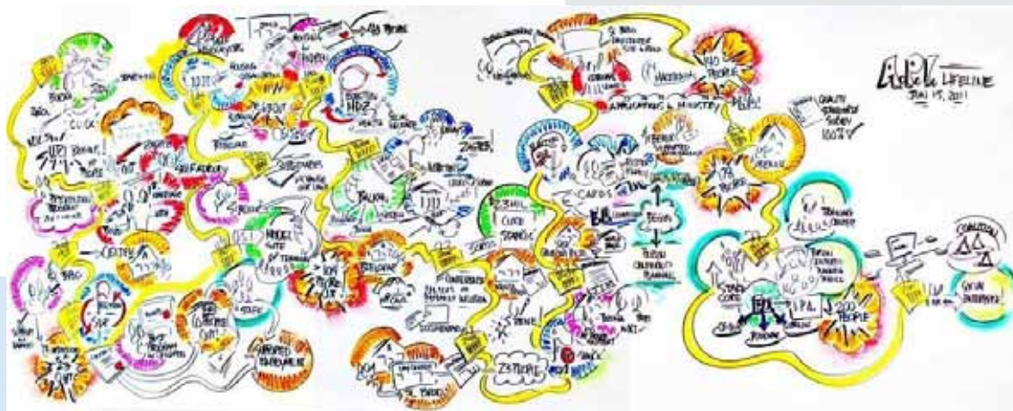
Association for Promoting Inclusion Life Line