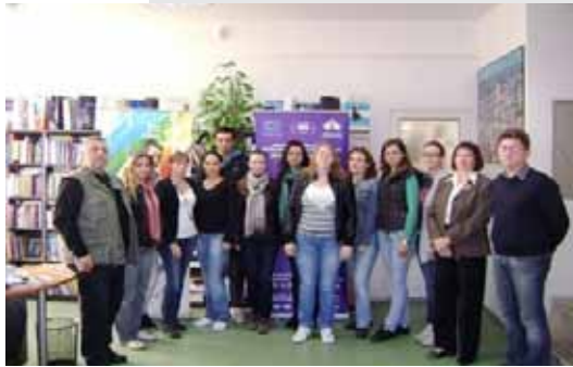
„Posjet tvrtki Grafika d.o.o.“