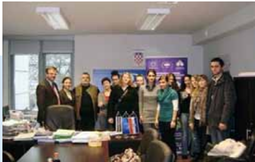
„Posjet Regionalnoj razvojnoj agenciji“