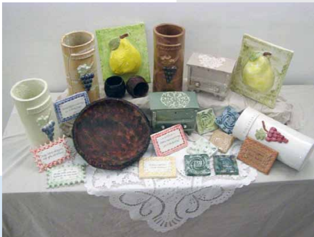
„Novi suveniri Sisačko-moslavačke županije izrađeni tijekom provedbe projekta“