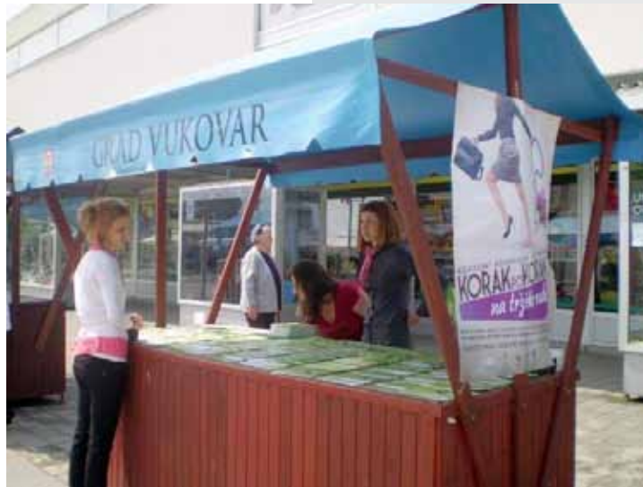
„Promicanje usluga čišćenja“