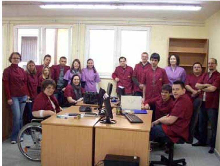
Sudionici u projektu