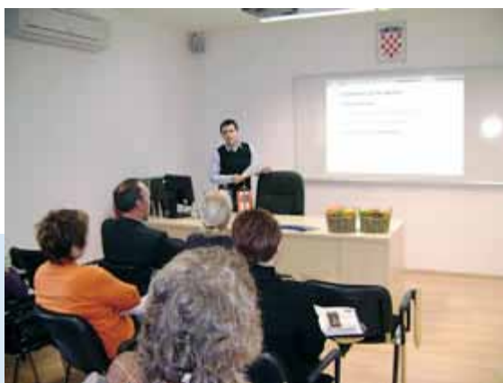
Informativni seminari za poslodavce o zapošljavanju učenika s teškoćama