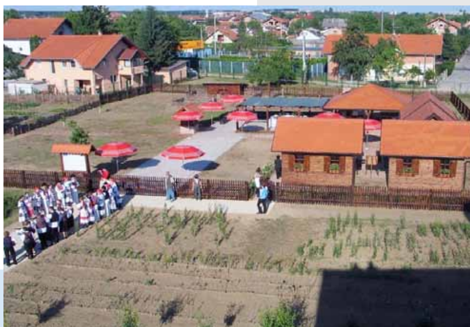
Agroturistički centar izvrsnosti – poligon