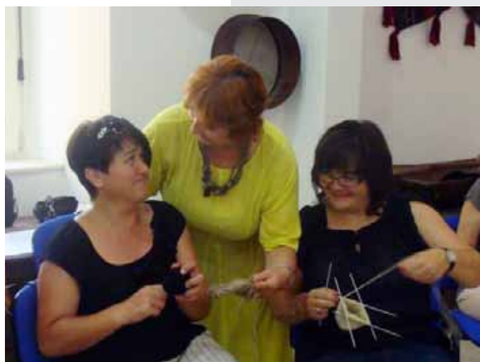
„Edukacija u Lici – Centar za tradicijske obrte u Senju“